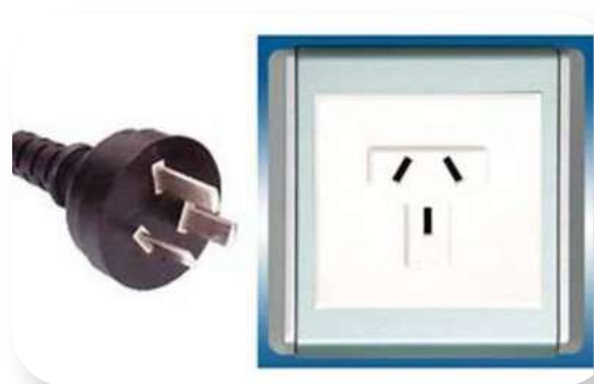
Tipo de enchufe más común en Argentina

En Argentina el voltaje común es 220 V. La frecuencia es 50 Hz.