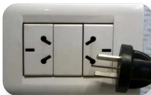
También puedes encontrar este tipo

BAIS es una ONG con más de 15 años encargada de la integración social de estudiantes extranjeros en Buenos Aires.